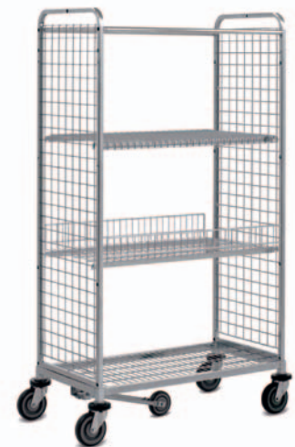
KOMMISSIONIERWAGEN KT3 Ausführungsbeispiel Das Pick-by-Frame®-System kann an alle KT3 Kommissionier- wagen angedockt werden.

Nach Abschluss der Kommissionierliste wird der Pick-by-Frame® per Knopfdruck von dem Wagen elektromagnetisch entriegelt und kann somit sofort für den nächsten Kommissionierauftrag mit einem neuen Wagen benutzt werden. Hervorzuheben ist die Möglichkeit, schnell und hochqualitativ mehrere Aufträge gleichzeitig zu bearbeiten.