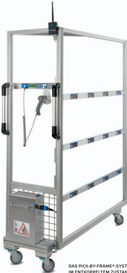
DAS PICK-BY-FRAME®-SYSTEM IM ENTKOPPELTEM ZUSTAND

■ Papierlos kommissionieren und dabei gleichzeitig mehrere Aufträge abwickeln – der KT3 Pick-by-Frame® macht's möglich! Nach Aktivierung der Kommissionierliste wird der Mitarbeiter über das Zentraldisplay wegeoptimiert zu einem Entnahmepunkt geführt. Mit einem Barcodescanner kann durch Lesung des Lagerortes oder des Artikels das korrekte Entnahmefach bestätigt werden. Das Zentraldisplay zeigt die Summe des jeweiligen Artikels für alle zu bearbeitenden Kommissionen an. Der Mitarbeiter sortiert nun die Gesamtmenge auf die aktivierten Zielfächer.