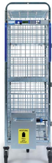
KT3 mit Akku und Versorgungsleitungen