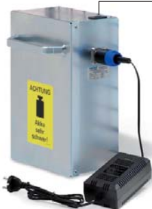
Mikroprozessor gesteuertes Ladegerät