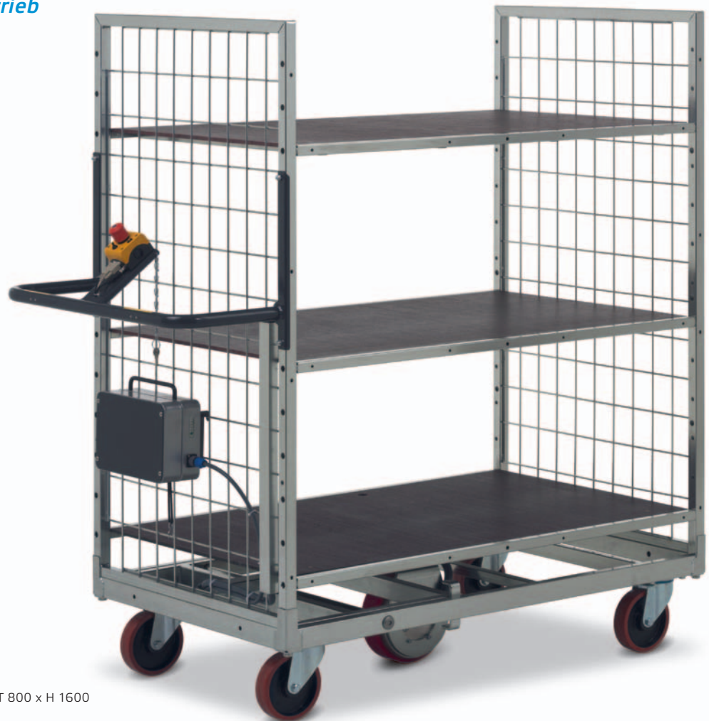
KT4 »DRIVE« Maße (mm): B 1300 x T 800 x H 1600