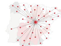
MODELO EN ASPA