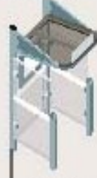
Mini lg 1.000 con carramios a la izquierda y a la derecha Ref. 529378