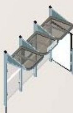
Longitud 3000 con 1 vitrina "2.000" a la derecha Ref. 529383