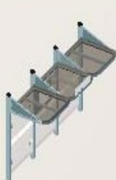
Longitud 3000 sin carramio lateral Ref. 529380