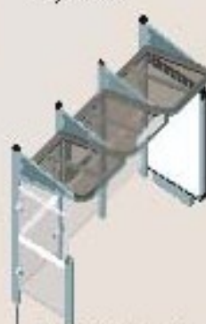
Longitud 3000 con 1 mpis luminoso a la derecha y 1 carramio a la izquierda Ref. 529388