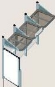
Longitud 3000 con 1 vitrina "2.000" a la izquierda Ref. 529389