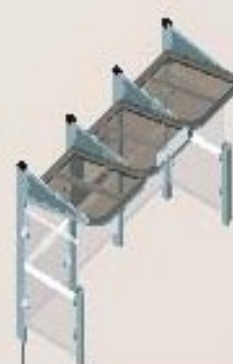
Longitud 3000 con carramios a la izquierda y a la derecha Ref. 529382