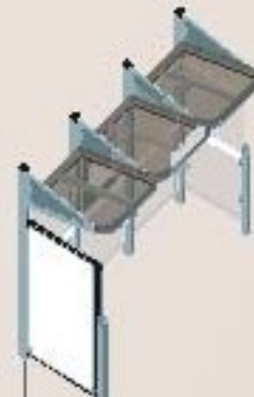
Longitud 3000 con 1 vitrina "2.000" a la izquierda y 1 carramio a la derecha Ref. 529386