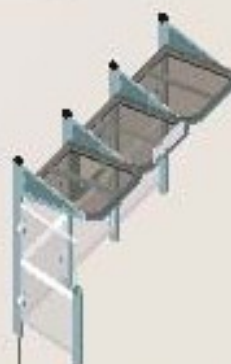
Longitud 3000 con carramio a la izquierda Ref. 529388