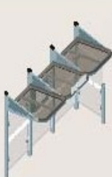
Longitud 3000 con carramio a la derecha Ref. 529381