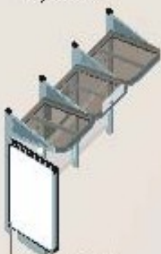
Longitud 3000 con 1 mpis luminoso a la izquierda Ref. 529387