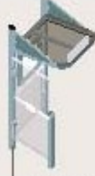
Mini lg 1.000 carramio a la izquierda Ref. 529377