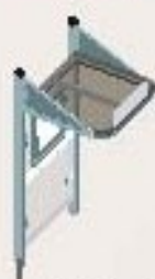
Mini lg 1.000 sin carramio lateral (vdadzo) Ref. 529375