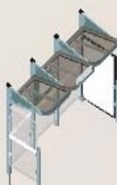
Longitud 3000 con 1 vitrina "2.000" a la derecha y 1 carramio a la izquierda Ref. 529385