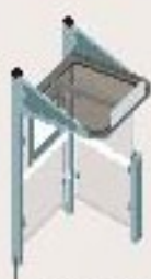
Mini lg 1.000 carramio a la derecha Ref. 529376