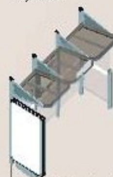
Longitud 3000 con 1 mpis luminoso a la izquierda y 1 carramio a la derecha Ref. 529388