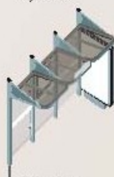
Longitud 3000 con 1 mpis luminoso a la derecha Ref. 529385